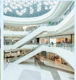
ショッピングモール